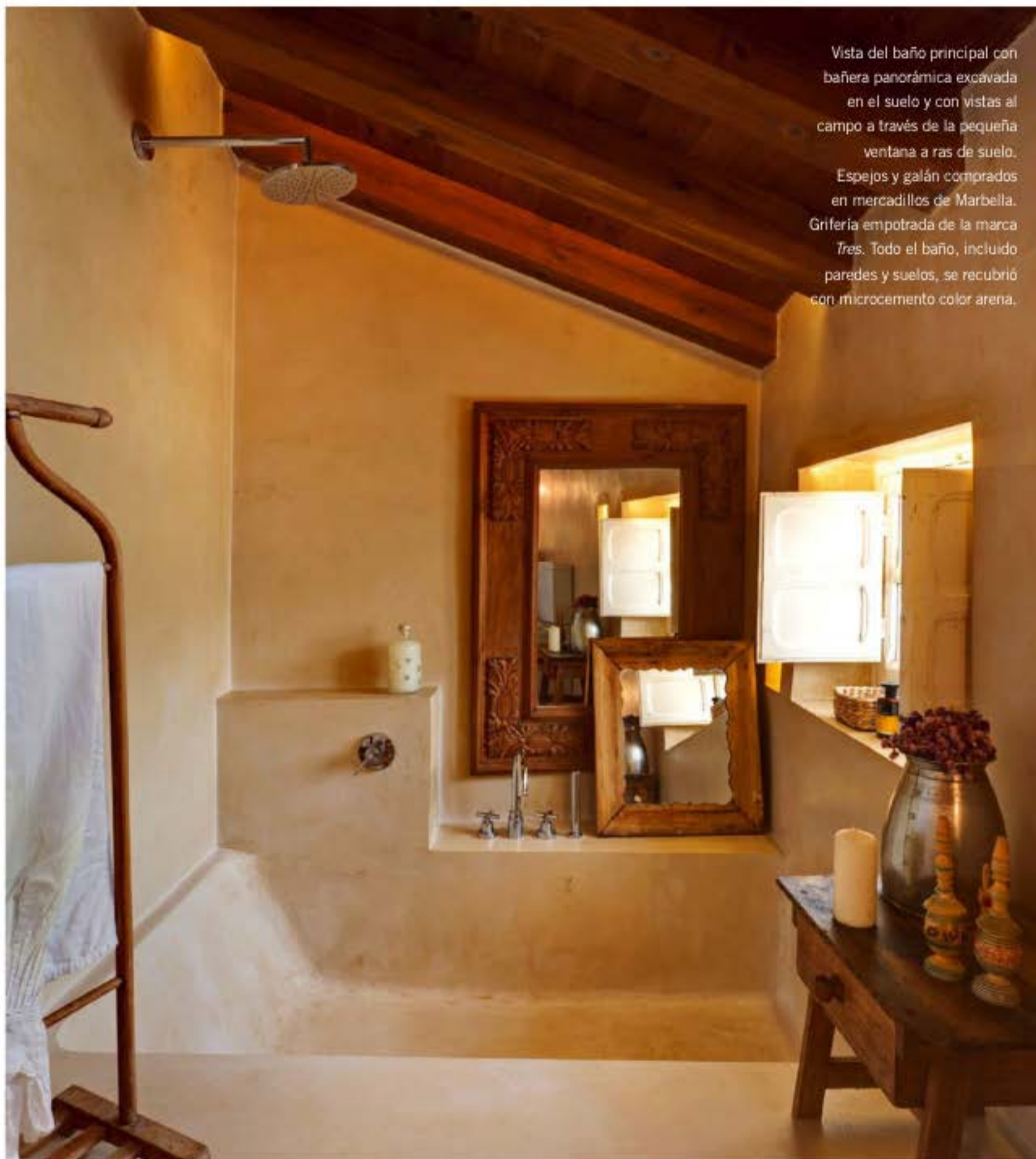
Vista del baño principal con bañera panorámica excavada en el suelo y con vistas al campo a través de la pequeña ventana a ras de suelo. Espejos y galán comprados en mercadillos de Marbella. Grifería empotrada de la marca Tres. Todo el baño, incluido paredes y suelos, se recubrió con microcemento color arena.

>> del conjunto. La iluminación artificial a base de luces indirectas crea un interesante contraste con los materiales rústicos con los que está realizado el contenedor. Resaltan las texturas naturales que se iluminan con tiras de led ocultas en las cerchas de madera o la mampostería de piedra de las paredes. Completan el diseño lumínico multitud de pequeñas lámparas de pie o sobremesa repartidas en rincones estratégicos de las estancias. Los portalones originales fueron también recuperados y reubicados en las nuevas puertas de paso. Preciosos ejemplares realizados por artesanos locales en madera maciza con cuarterones y geometrías talladas. La casa cuenta además con tres chimeneas que llenan de calidez el hogar en los fríos días del invierno segoviano, cuando todo el jardín está cubierto por la nieve.