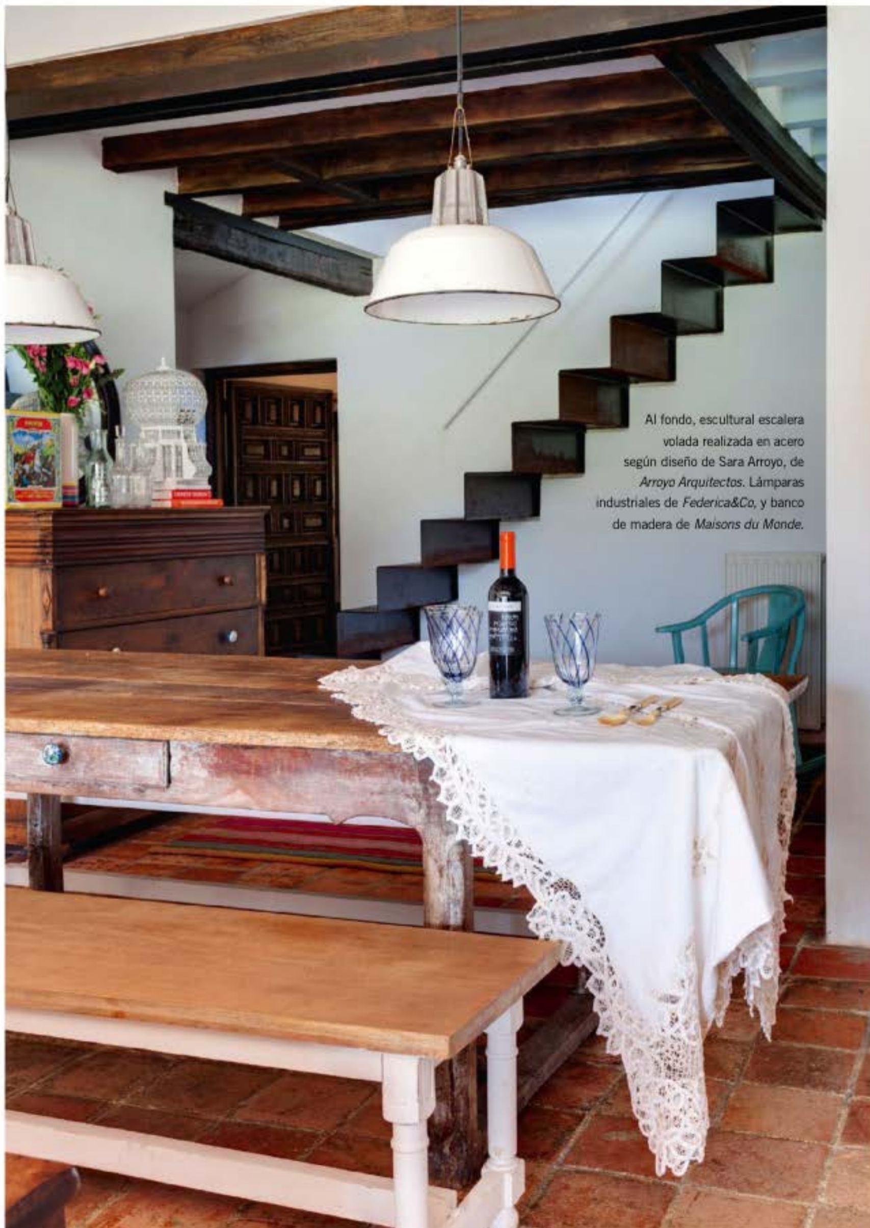
Al fondo, escultural escalera volada realizada en acero según diseño de Sara Arroyo, de Arroyo Arquitectos . Lámparas industriales de Federica&Co , y banco de madera de Maisons du Monde .