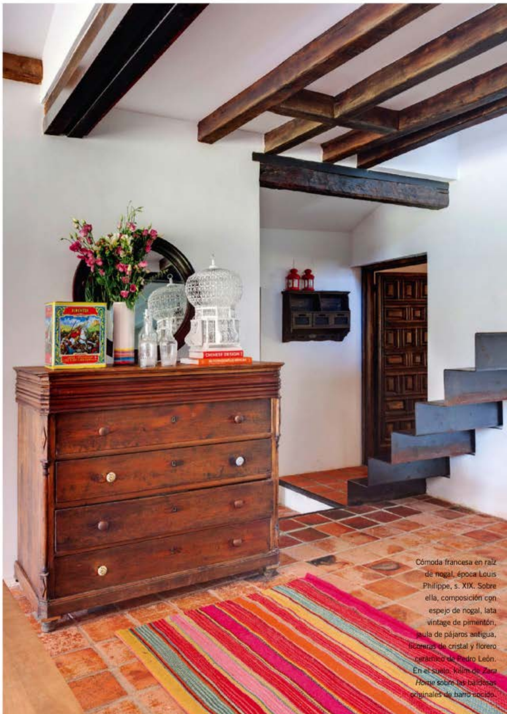
C6m6da francesa en raiz de nogal, 6poca Louis Philippe, s. XIX. Sobre ella, composici6n con espejo de nogal, lata vintage de piment6n, jaula de p6jaros antigua, lic6reras de cristal y florero cer6mico de Pedro Le6n. En el suelo, kilim de Zara Home sobre las baldosas originales de barro cocido.