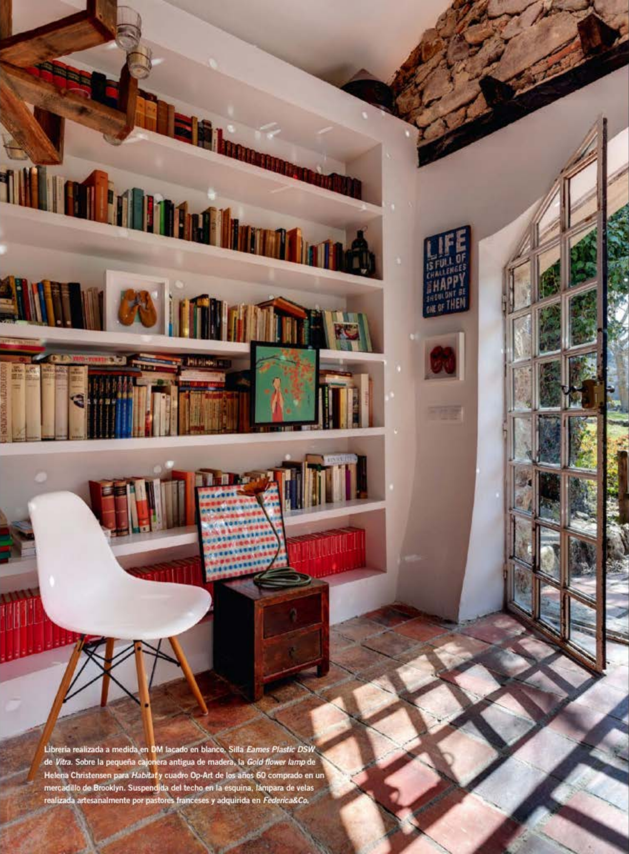
Librería realizada a medida en DM lacado en blanco. Silla Eames Plastic DSW de Vitra . Sobre la pequeña cajonera antigua de madera, la Gold flower lamp de Helena Christensen para Habitat y cuadro Op-Art de los años 60 comprado en un mercadillo de Brooklyn . Suspendeda del techo en la esquina, lámpara de velas realizada artesanalmente por pastores franceses y adquirida en Fedenco&Co .