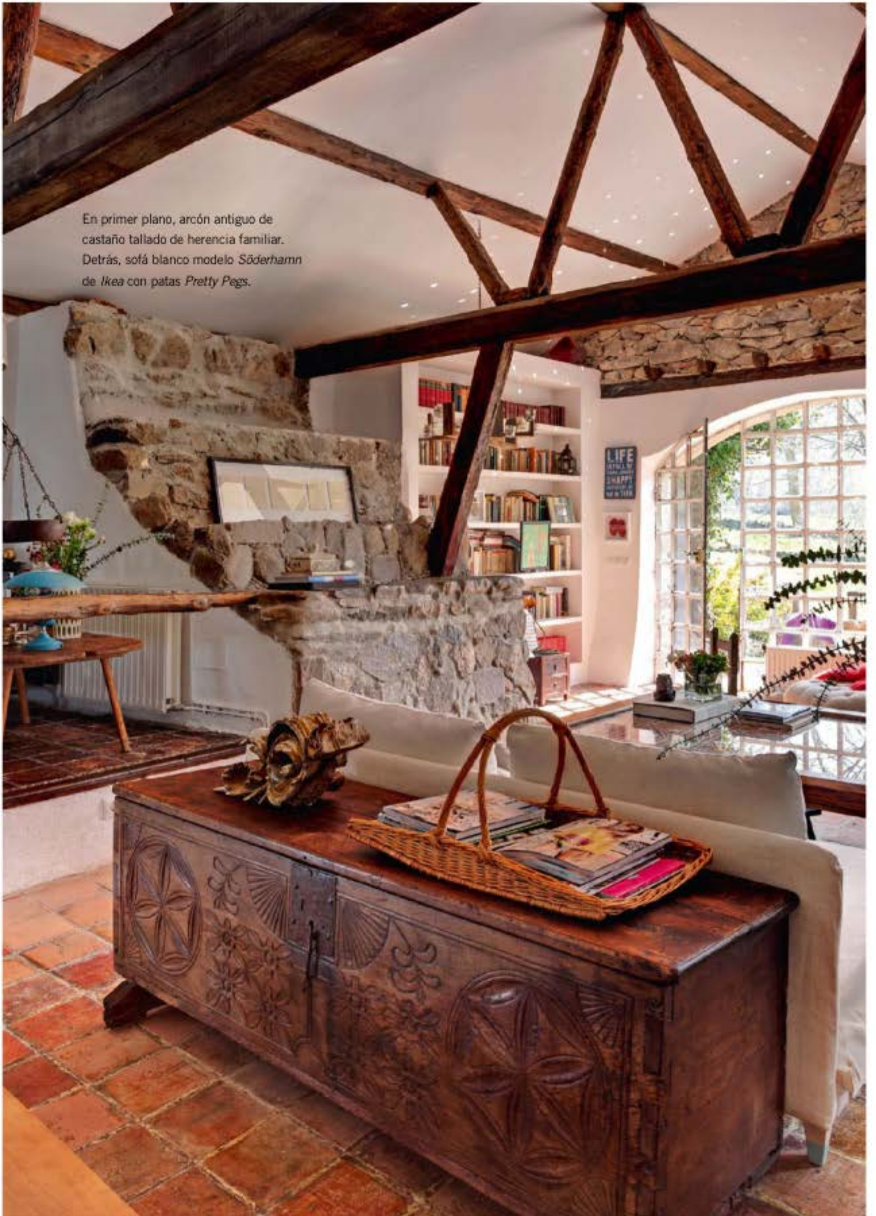
En primer plano, arcón antiguo de castaño tallado de herencia familiar. Detrás, sofá blanco modelo Söderhamn de Ikea con patas Pretty Pegs.